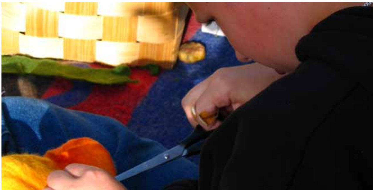
I Västerbottens län drivs slöjklubbar för barn och unga av konsulenterna i Västerbottens läns hemslöjdsförening i samarbete med Studieförbundet Vuxenskolan.