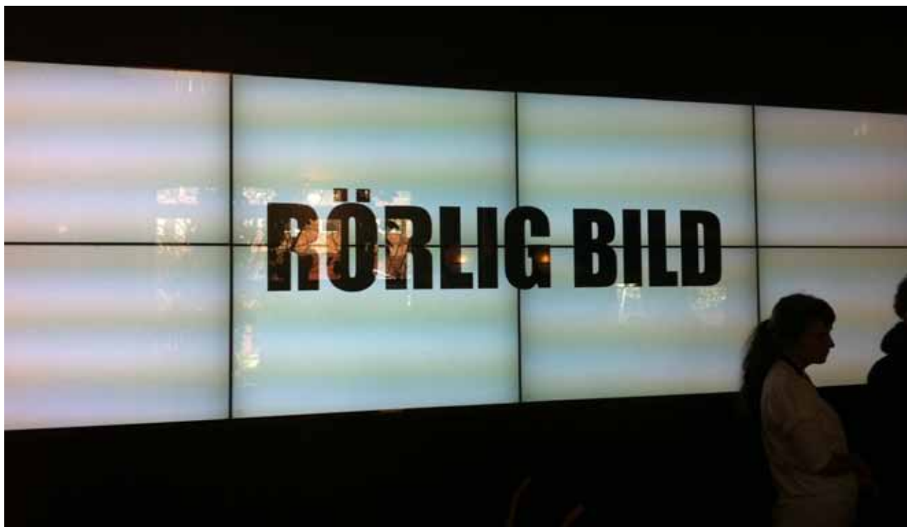
Under en höstvecka i oktober står rörlig bild i centrum genom festivalen MOVE. Västerbottens Amatörfilmfestival (VAFF), en filmtävling för västerbottensk kortfilm och skolbiofestivalen Tjugo5 är två av flera programpunkter under veckan.

turplanen skickades ut på remiss till länets kommuner och regionala kulturverksamheter under perioden 25 augusti – 5 september. Den regionala kulturplanen fastställs av förbundsfullmäktige den 17 november.