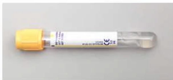
Serumrör med gel 7 mL (drar 5 mL blod)

Det provrör som ska användas vid serologisk diagnostik är serumrör 7 mL (blodvolym 5mL) med gel, guldgul kork. Artikelnummer 12707.